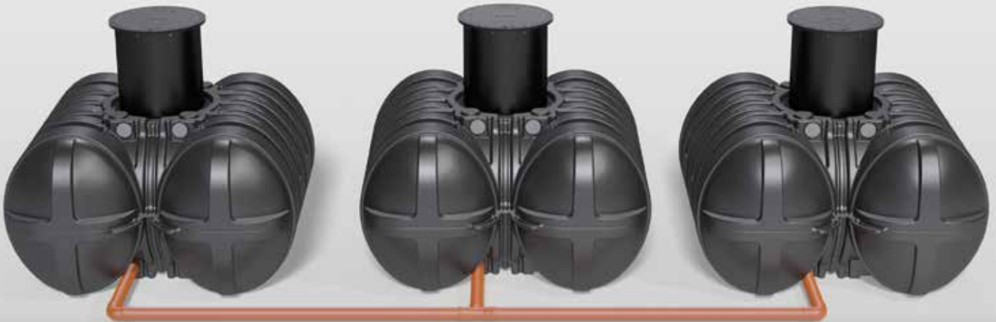
Beispiel zeigt 3 x Twinbloc 5000 Liter