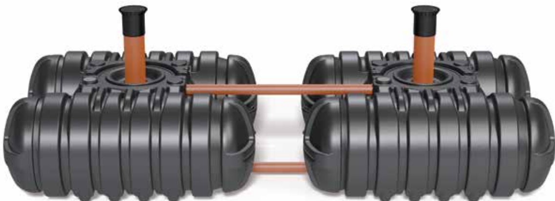
Verbindung von Roth Sammelgruben und Abwassertanks (Beispiel zeigt Sammelgrube Twinbloc 3500 Liter.)

Die Verbindung der Roth Sammelgrube Twinbloc 3500 Liter ist gemäß allgemeiner bauaufsichtlicher Zulassung möglich. Hier erfolgt die Kopplung der Behälter sowohl im Boden- als auch im Sattelbereich der Tanks. Durch die zweifach vorhandene Verbindungsleitung können eventuelle Verstopfungen durch Feststoffe im Abwasser effektiv verhindert werden. Weiterhin ist so der Einsatz von nur einer Roth Absaugvorrichtung zur Entleerung beider Tanks gleichzeitig sichergestellt. Es wird empfohlen, die Bohrungen für die Verbindungsleitung bereits werkseitig anfertigen zu lassen.